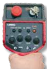
Radiocomando di serie