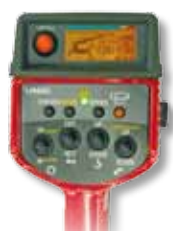
Radiocomando opzionale con visualizzazione digitale